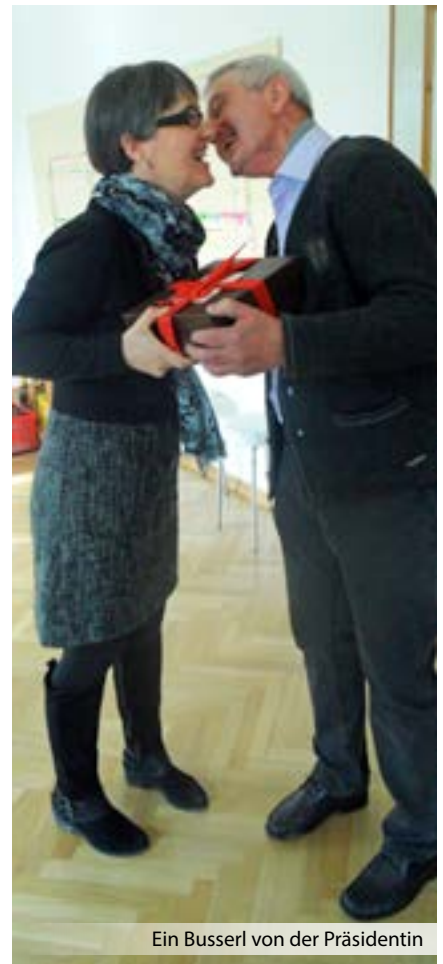
Ein Busserl von der Präsidentin