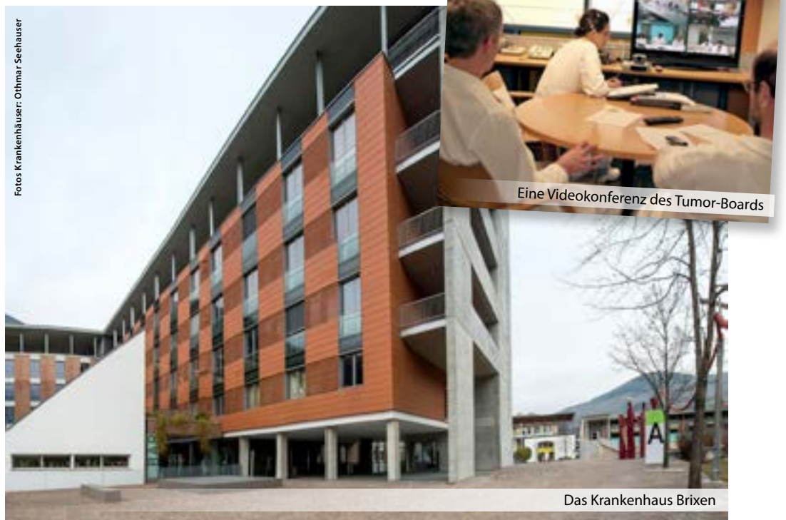
Das Krankenhaus Brixen