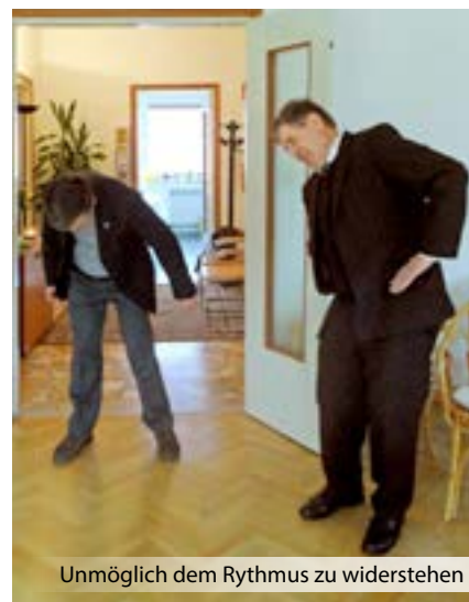
Unmöglich dem Rythmus zu widerstehen