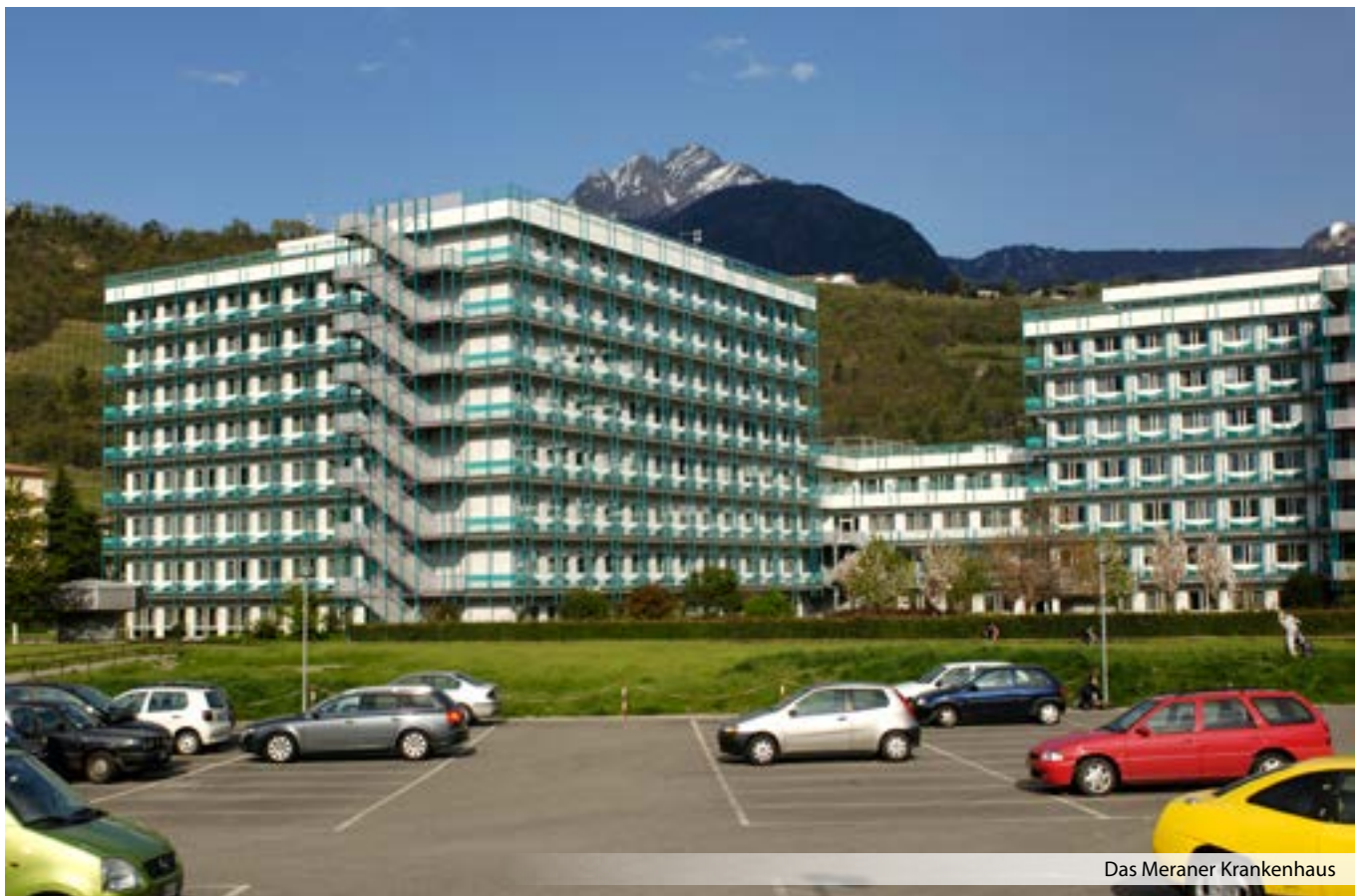
Das Meraner Krankenhaus

„Eine Zertifizierung nach europäischen Standards hätte ich für meine Abteilung ohnehin angestrebt; nun ist diese sozusagen von oben verordnet worden.“ Für