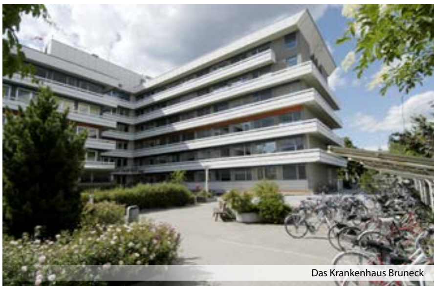
Das Krankenhaus Bruneck

Keinesfalls darf die Kropf- und Rektumchirurgie in einem Schwerpunktkrankenhaus fehlen, wenn dieses nicht in die Bedeutungslosigkeit schlittern soll. Diese Perspektiven lassen Konsequenzen für den chirurgischen Nachwuchs befürchten, d. h., es wird niemand mehr nach Bruneck kommen wollen. Eine Facharztausbildung wäre mit einer reduzierten Fragment-Chirurgie nicht mehr möglich.“ ■