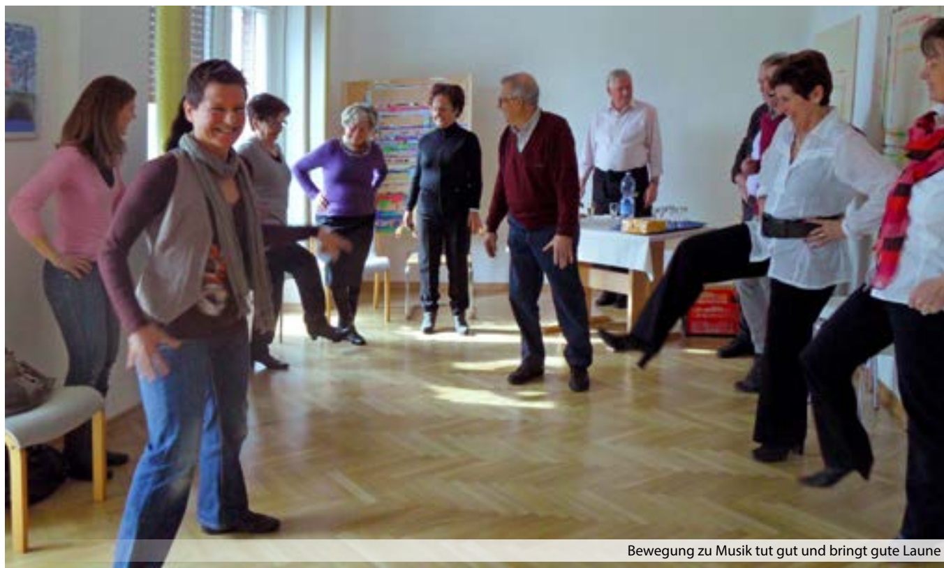
Bewegung zu Musik tut gut und bringt gute Laune

Körper auch für die Heilung sei und lud zu einer spontanen gemeinsamen Gymnastik-session zur Musik von Zucchero ein, der alle Gäste gerne folgten.