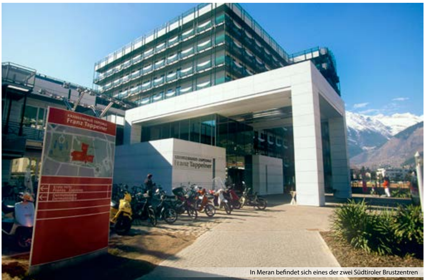
In Meran befindet sich eines der zwei Südtiroler Brustzentren

den. „Es geht allein um das Interesse der Patienten, darum, Ihnen die bestmögliche, nach modernsten Kriterien ausgerichtete Behandlung anbieten zu können.“ ■