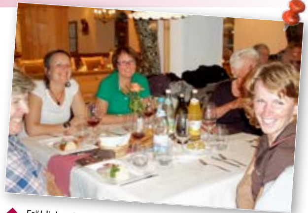
▲ Fröhliches Beisammensein beim Törggelen des Bezirks Pustertal beim Lanerhof in Montal am 24. Oktober