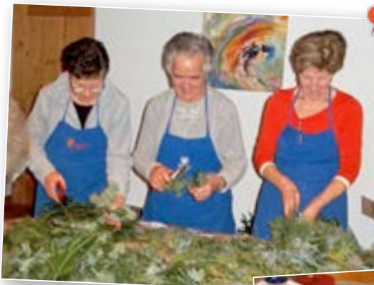
▲ Weihnachtsmarkt Die freiwilligen Helferinnen beim Winden der Adventskränze