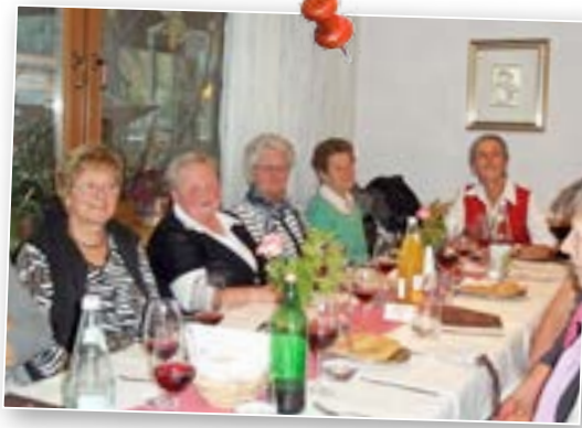
◀ Die Unterpustertaler Törggelgruppe