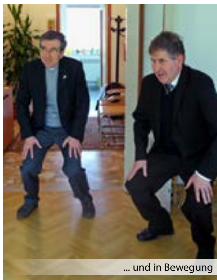
... und in Bewegung