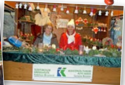
◀ Weihnachtsmarkt ▲ Der Verkaufsstand am Weihnachtsmarkt in Bruneck im Tschurtschenthalerpark