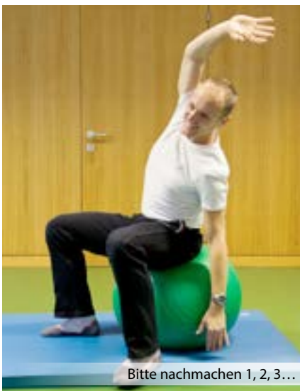
Bitte nachmachen 1, 2, 3...

mit Freude und ohne Stress mitmachen konnte. Ich finde solche Kurse auch deshalb angenehm, weil man immer nette Leute wiedertrifft oder neu kennenlernt. Mit meinem Mann nehme ich auch regelmäßig am Seniorenturnen teil und ich fahre regelmäßig zuhause Rad. Und morgen (am Tag nach dem Interview, Anm. d. Red.) haben wir das erste Treffen mit der Wassergymnastik.“ ■