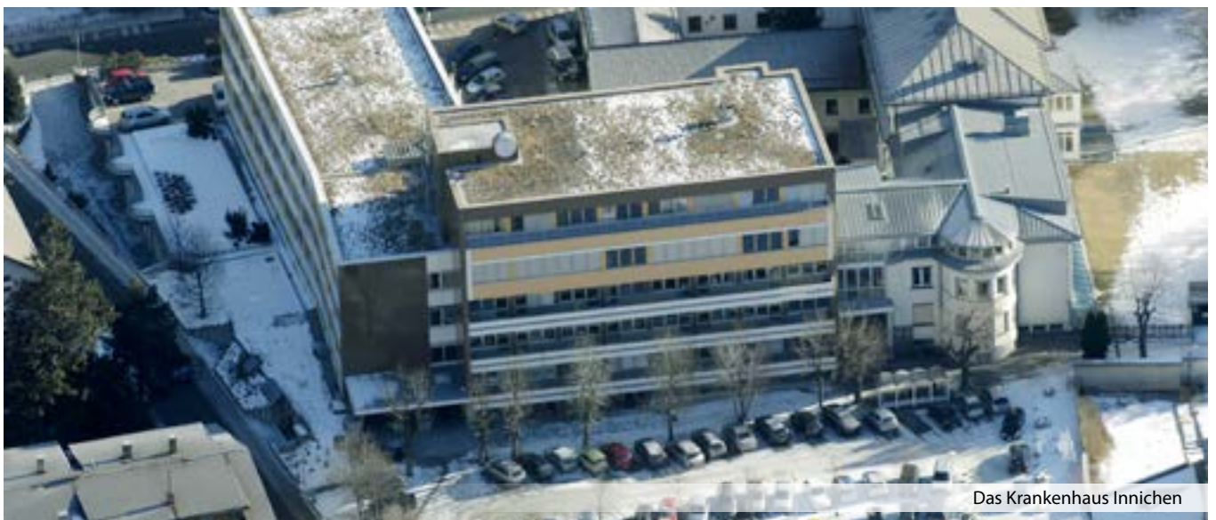
Das Krankenhaus Innichen

Er hätte eine Reform vorgezogen, die die gesamten auf dem Territorium vorhandenen Kräfte in ein Netzwerk einbaut und dementsprechend nutzt. „Anstelle des Patienten würden sich dann die Ärzte bewegen. Für jede Operation könnte man eine Equipe zusammenstellen, mit den Ärzten, egal in welchem Krankenhaus sie stationiert sind, die diesen Eingriff am besten beherrschen.“ ■