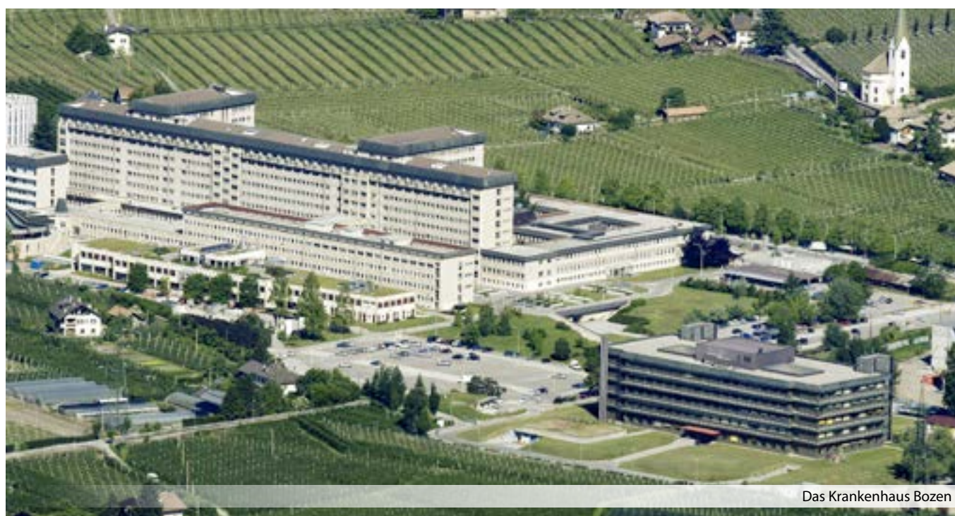
Das Krankenhaus Bozen

können.“ Zahlen seien nicht alles und allein nicht aussagekräftig. Aber Zahlen seien ein Indiz, an dem Qualität und Routine ausgemacht werden könnten. ■