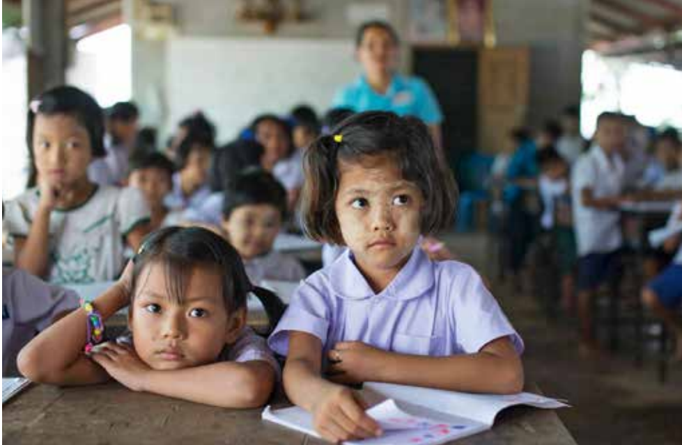
Scuola New Day