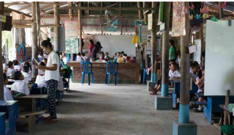
Scuola Ah Yone Oo