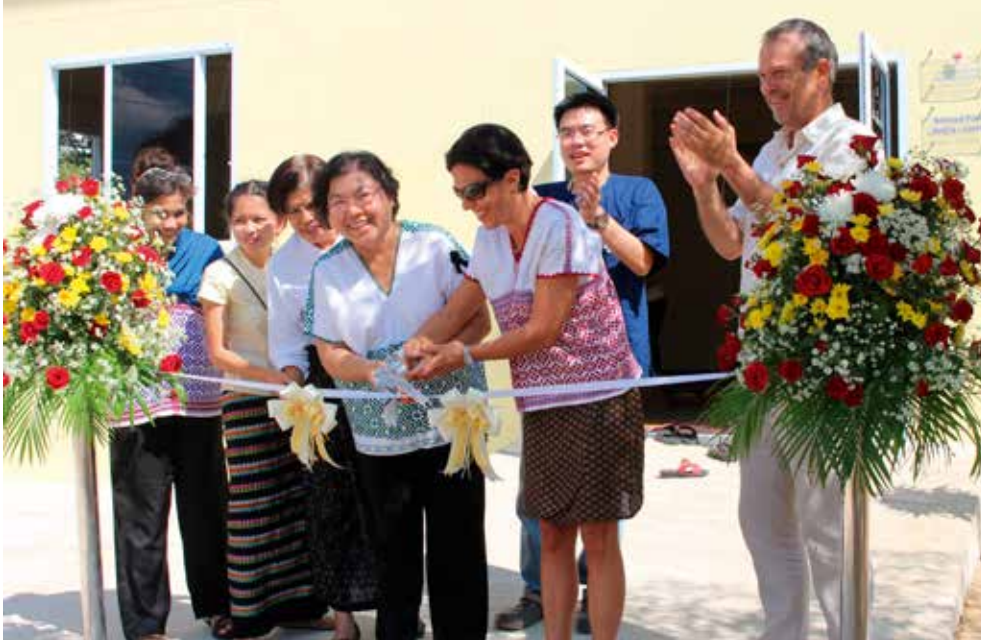
Il 20/11/2016 è stato inaugurato il nuovo centro giovanile Rays of Youth a Mae Sot.