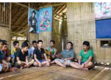
Casa famiglia Tha Kaw Kla