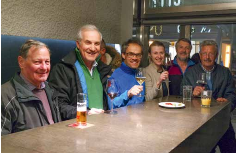
I nostri volontari brindano alla conclusione del montaggio dei pannelli fotografici