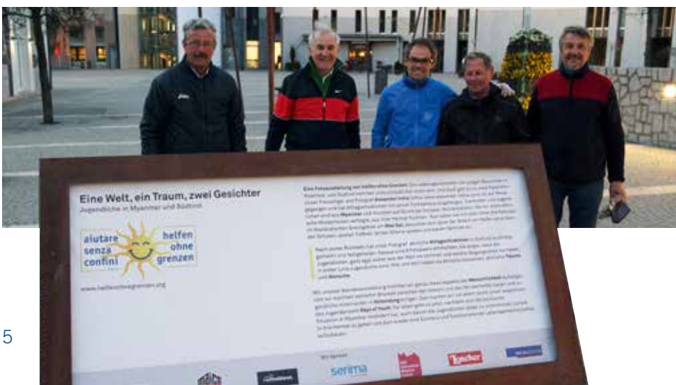
Mostra fotografica "Un mondo, un sogno, due volti"

Nel mese di marzo ci è giunta la notizia scioccante che 14 scuole a Mae Sot erano sull'orlo del lastrico e 2.250 bambini rischiavano di tornare per strada. Questi bambini senza scuola, non solo rischiano di perdere una possibilità per un futuro,