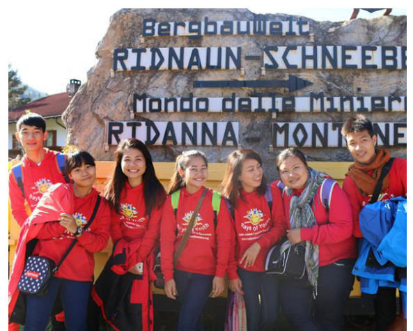
I "Rays of Youth" alle miniere di Ridanna