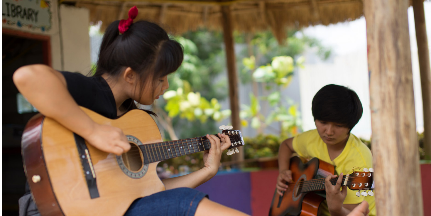
I "Rays of Youth" a scuola

WASH – acqua, servizi igienico-sanitari)