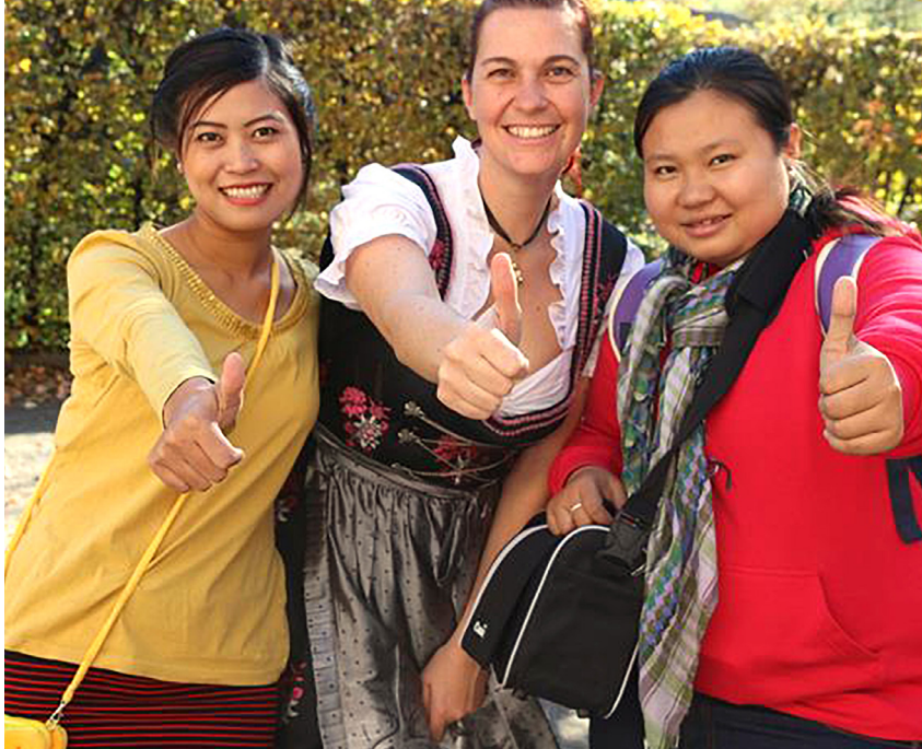
Due culture che si incontrano

non vengono utilizzate le donazioni bensì altre fonti preposte esclusivamente a questo scopo.