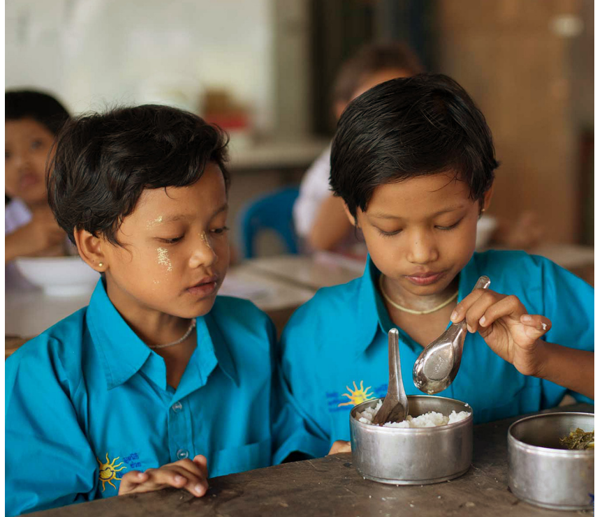
Il progetto agricolo