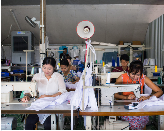
La nostra sartoria "The Happy Tailor"