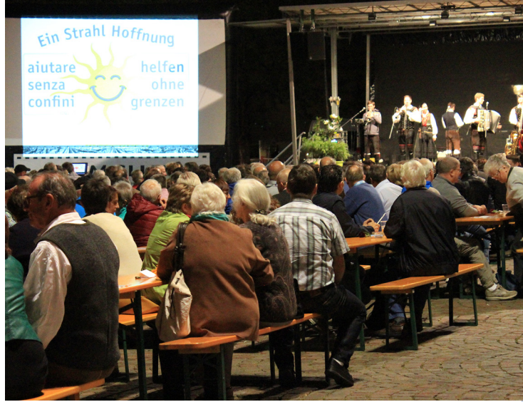
“Saso Avsenik e gli Oberkrainer” in Piazza Duomo a Bressanone

L'Istituto sui Diritti delle Minoranze dell'EURAC ha organizzato la conferenza “Diritti delle minoranze, apertura e situazione politica in Birmania: il punto di vista dei ragazzi”. I nostri “Rays of Youth” hanno parlato della loro vita, del loro lavoro, dell'attuale situazione politica in Birmania e del ruolo che vorrebbero avere in futuro nel loro paese. 350 studenti delle scuole medie e superiori hanno riempito l'auditorium dell'EURAC.