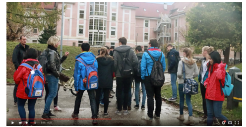
I nostri "Rays of Youth" nelle scuole in Alto Adige

Molti corsi di formazione vengono ormai organizzati e tenuti dai nostri giovani "Rays of Youth". Trovate ulteriori informazioni nel paragrafo che segue.