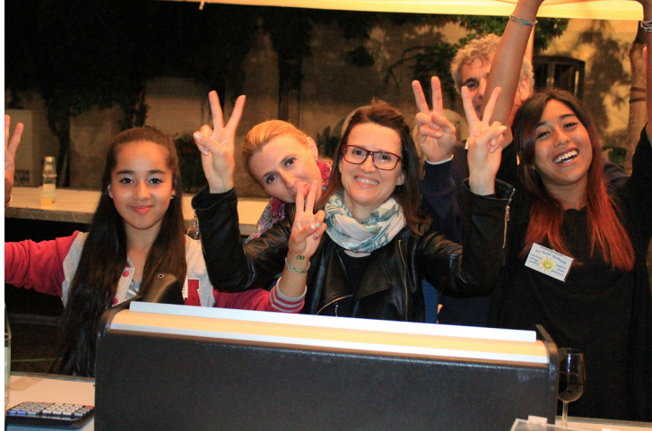
I nostri volontari al concerto di beneficenza degli Oberkrainer

ricavato 10.525 euro, che corrispondono a oltre 35.000 pasti per i nostri bambini!