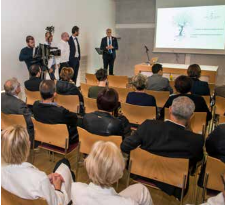
Die Einweihung des neuen Linearbeschleunigers war Anlass für einen Rückblick auf die Geschichte der Strahlentherapie in Südtirol