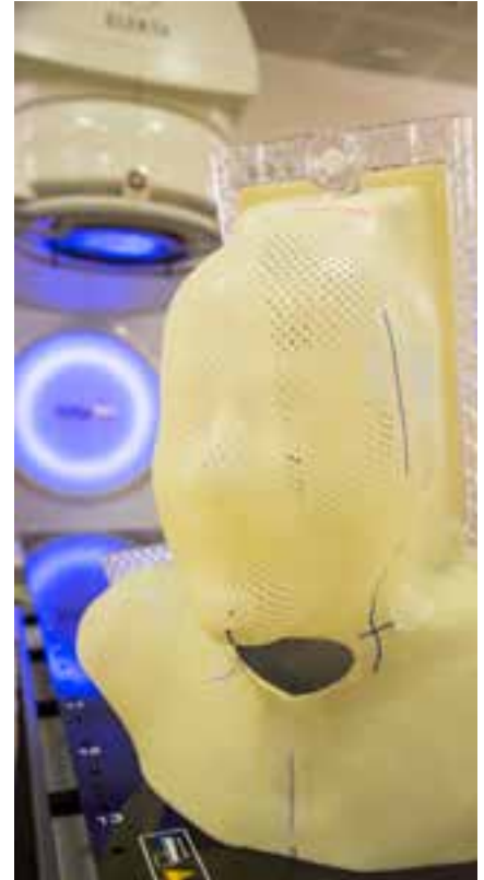
Eine individuell angepasste Bestrahlungsmaske