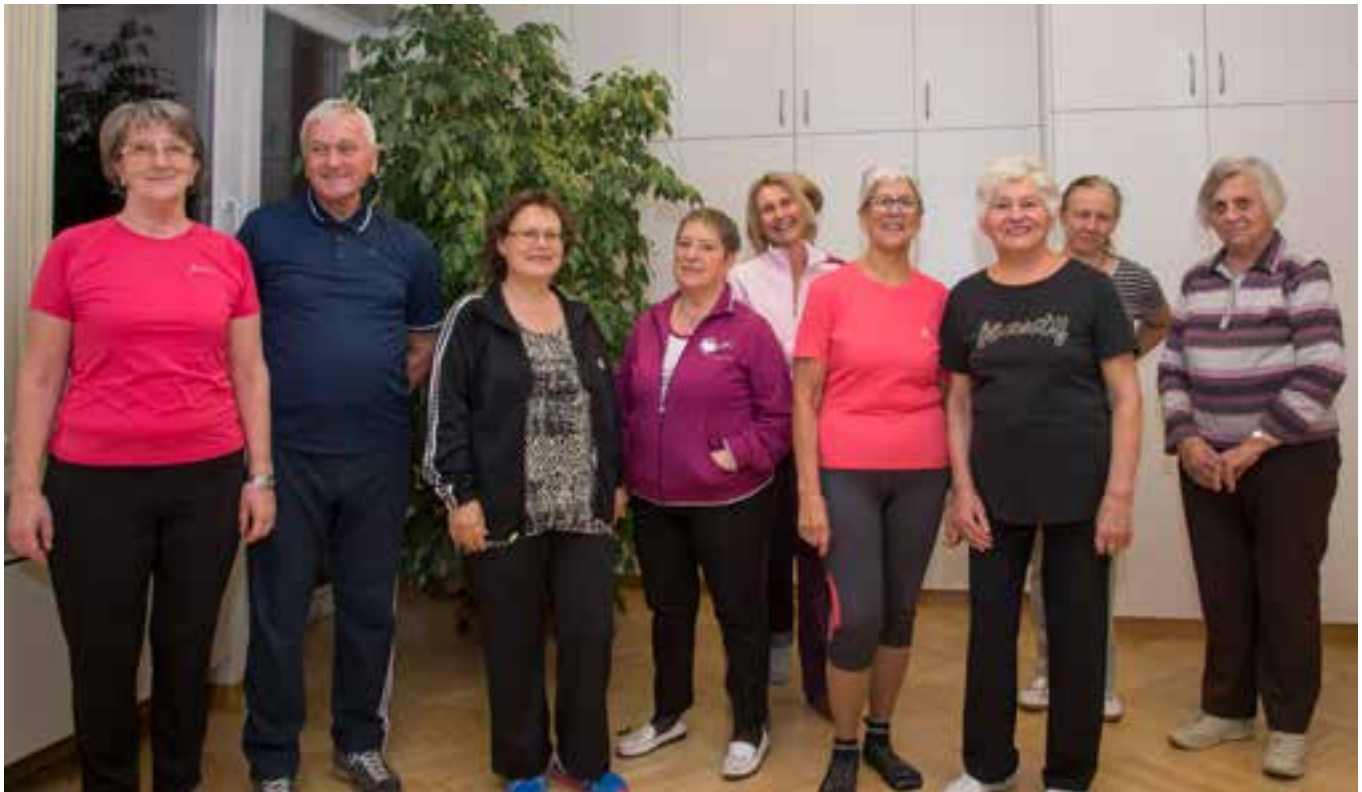
Jeden Dienstag um 17 Uhr treffen sie sich zum Meditationsturnen

> Die ersten zehn Minuten sind dem Aufwärmen gewidmet. Von den Fußzehen bis zum Kopf wird nach und nach jeder Muskel aufgewärmt und auf die Übungen vorbereitet. Vom Bewegen der Fußzehen bis zum langsamen Kreisen des Kopfes. Mit offenen Augen, um Schwindel zu vermeiden.