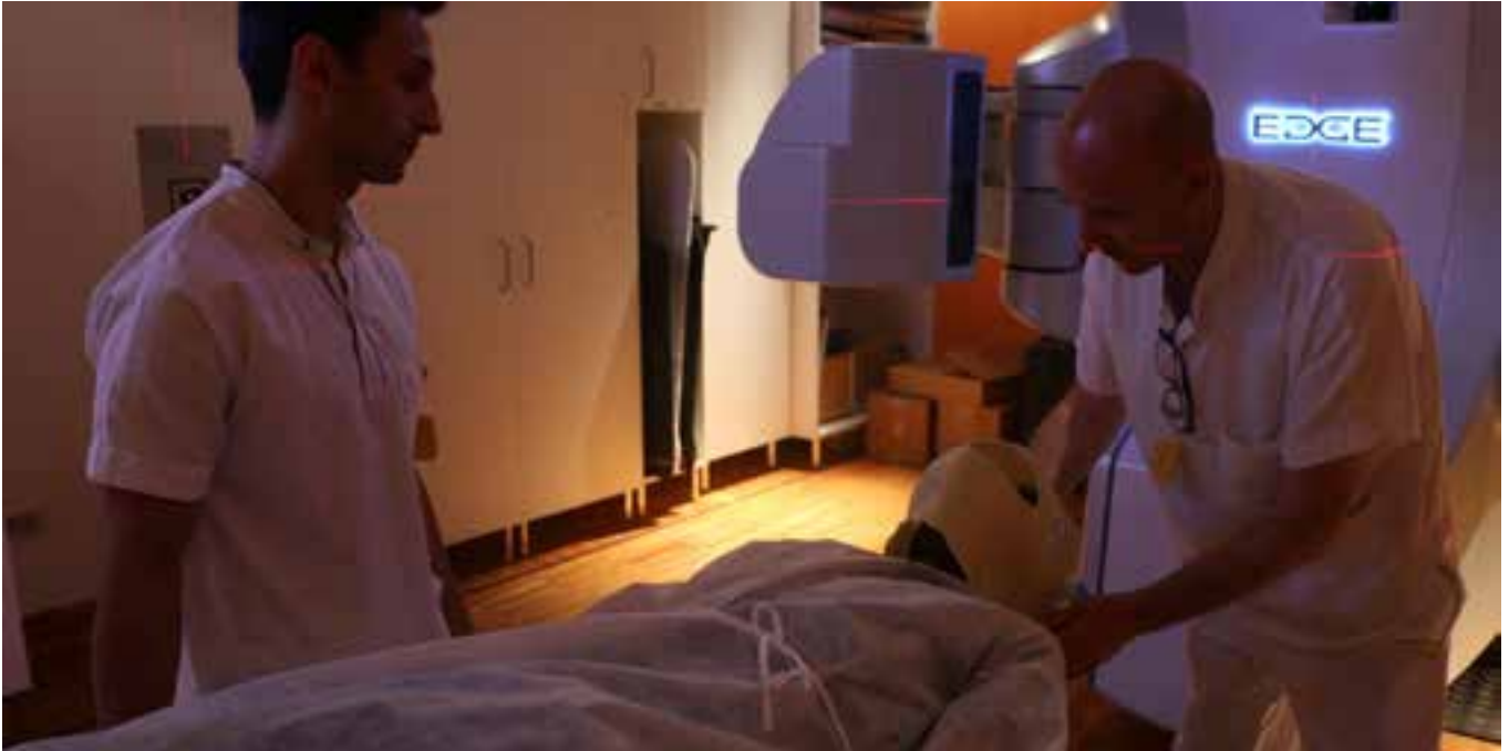
Mit EDGE ist die Zahl der Behandlungen auf ein Minimum und auf wenige Minuten reduziert. Der Patient kann seinem gewohnten Leben nachgehen.

der Bauchspeicheldrüse, aber auch die radiochirurgische Behandlung von primären Tumoren, wie z. B. Prostatakrebs oder bei Kopf-Hals-Karzinomen. Die hochdosierten Strahlen übernehmen die Funktion eines virtuellen Skalpells.