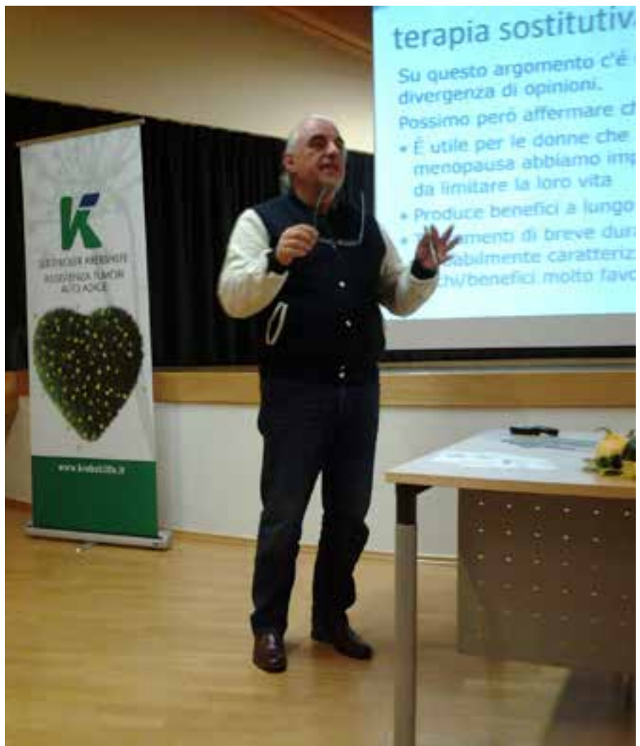
„In der Regel dauert es ein Jahr, bis sich alles eingespielt hat.“

Nicht zu unterschätzen sei der psychologische Aspekt, betont der Gynäkologe. „Es ist ein Unterschied, ob ich mich reif fühle oder alt!“ Der Lebensstil sollte an die neue Situation angepasst werden. Viel Bewegung, wenig Alkohol, Nicht- Folgt >