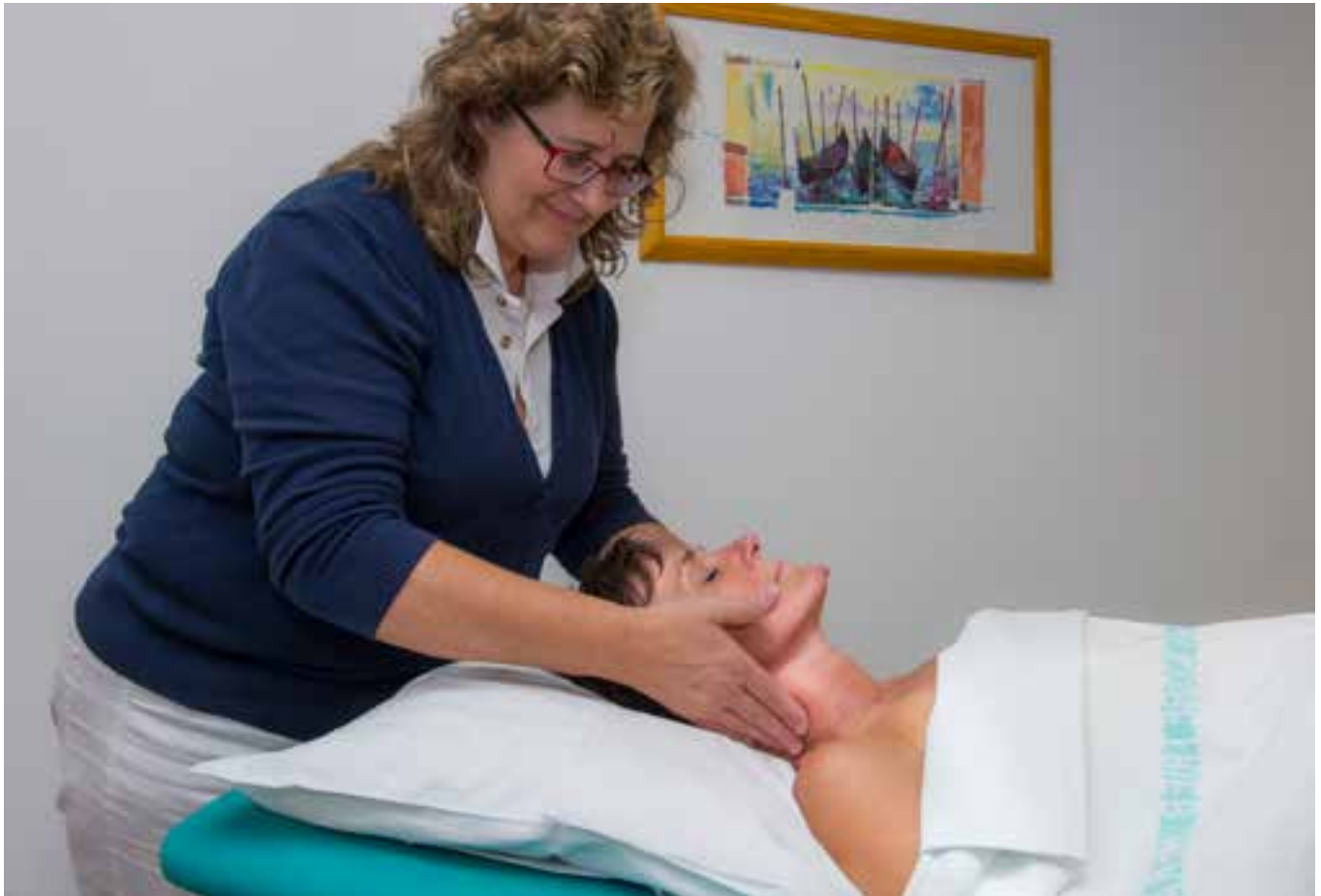
Lymphdrainage beginnt am Hals. Sanfte Streich- und Druckbewegungen

Ein wichtiger Aspekt im Rahmen von Lymphbeschwerden ist auch die Körperhygiene. „Während der Behandlung vermitteln wir auch Tipps zur richtigen Körperpflege, lehren die Patienten sich ihres Körpers anzunehmen.“