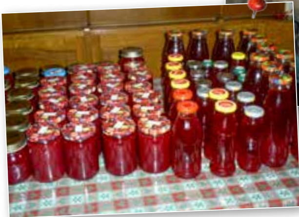
◀ Weihnachtsmarkt Benefizmarkt 2016 Vorbereitung von Marmeladen und Säften für den Weihnachtlichen Benefizmarkt 2016