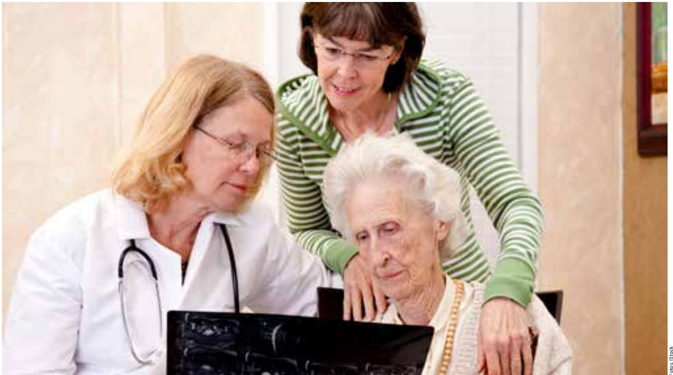
Auch wer arbeitet kann dank der beiden Gesetze 104 und 151 einem bedürftigen Angehörigen beistehen, ohne deshalb finanzielle Einbußen oder Probleme am Arbeitsplatz befürchten zu müssen.