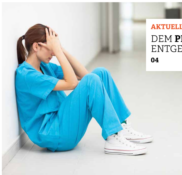
AKTUELL DEM PFLEGEMANGEL ENTGEGENWIRKEN 04