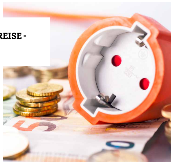
AKTUELL HOHE STROMPREISE - WAS NUN? 06